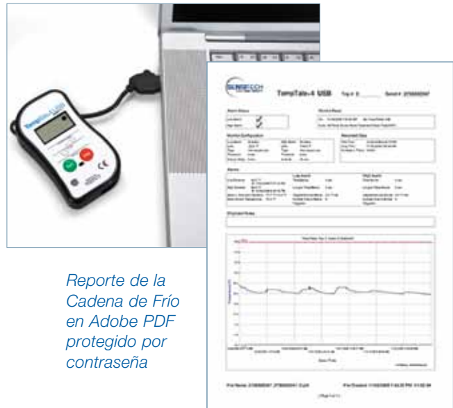
Reporte de la Cadena de Frío en Adobe PDF protegido por contraseña

Como el proveedor mundial líder en soluciones para la visibilidad de la cadena de frío, Sensitech le permite a sus clientes, líderes mundiales de la industria Alimenticia y Farmacéutica, monitorear y controlar sus activos a través de la cadena de distribución para proteger la integridad de los productos sensibles a la temperatura. Sensitech es una empresa con certificación ISO 9001:2008 y esta ubicada en Beverly, Massachusetts, EU; con oficinas en Santiago, Ámsterdam, Boston, Calgary, Melbourne, Mumbai, Redmond y Shangai, así como oficinas de distribución y servicio alrededor del mundo. Sensitech es una subsidiaria de Carrier Corp., con base en Farmington, Connecticut, el proveedor mundial más grande de soluciones de aire acondicionado, refrigeración, y calefacción, con operaciones en 172 países. Carrier Corp. es parte de United Technologies Corp. (NYSE:UTX), con base en Hartford, Connecticut, proveedor de una amplia gama de productos de alta tecnología y servicios de soporte para las industrias espaciales y de creación de sistemas alrededor del mundo. Para mayor información, favor de llamar al: +1-978-927-7033 o visitar el sitio www.sensitech.com . © 2009. Sensitech Inc. Todos los derechos reservados. Todos los productos y servicios registrados son propiedad de Sensitech.